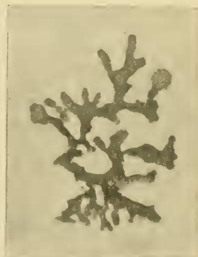
Fig. 2. Physma intricatissimum Stnr. Thalluslappen. Vergr. ca. 20.

Hyphae medullares in sectione pertenui tantum (reag. sol. parum prosunt) inter vaginas et gonidia perspicuae, dendroideo et curvato ramosae, inaequaliter